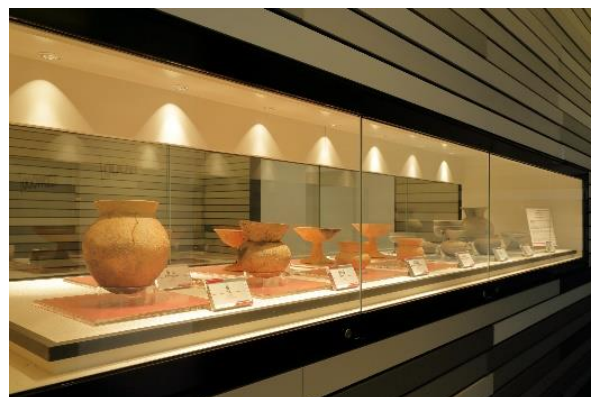
足元に古墳時代の大型建物の復元模型、壁面には出土した一部破片を使用し復元した土器を展示。