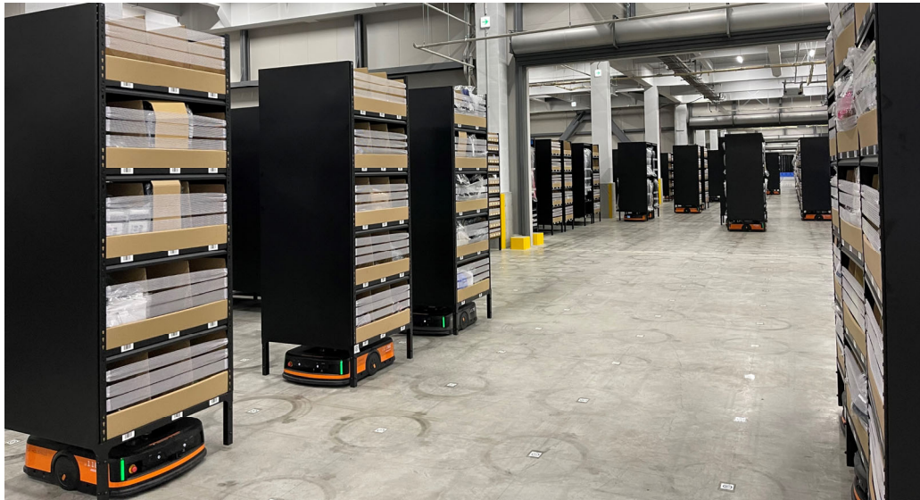
今回は600kg可搬の搬送ロボットデモを行います

株式会社Phoxter 設立2017年10月 世界トップの搬送ロボットメーカーHIKROBOT社の日本の正規代理店