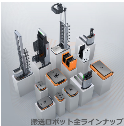
搬送ロボット全ラインナップ