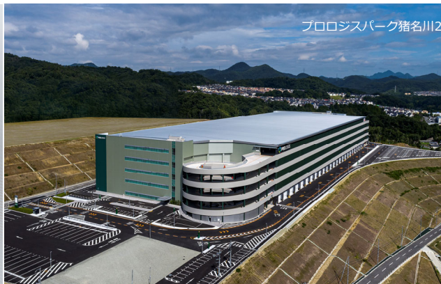
プロロジスパーク猪名川2