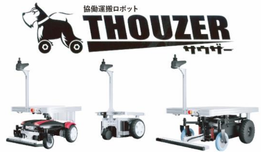
遠隔制御ソフト 「サウザーリンクス」

多様な環境対応、柔軟な運用ができ、遠隔制御ソフト「サウザーリンクス」により工程間搬送業務の省人化、効率化を実現。 台車やカゴ車などの牽引、自動切離機構の追加により更に幅広い搬送業務の効率化を実現します。