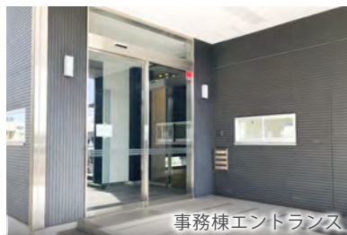
事務棟エントランス